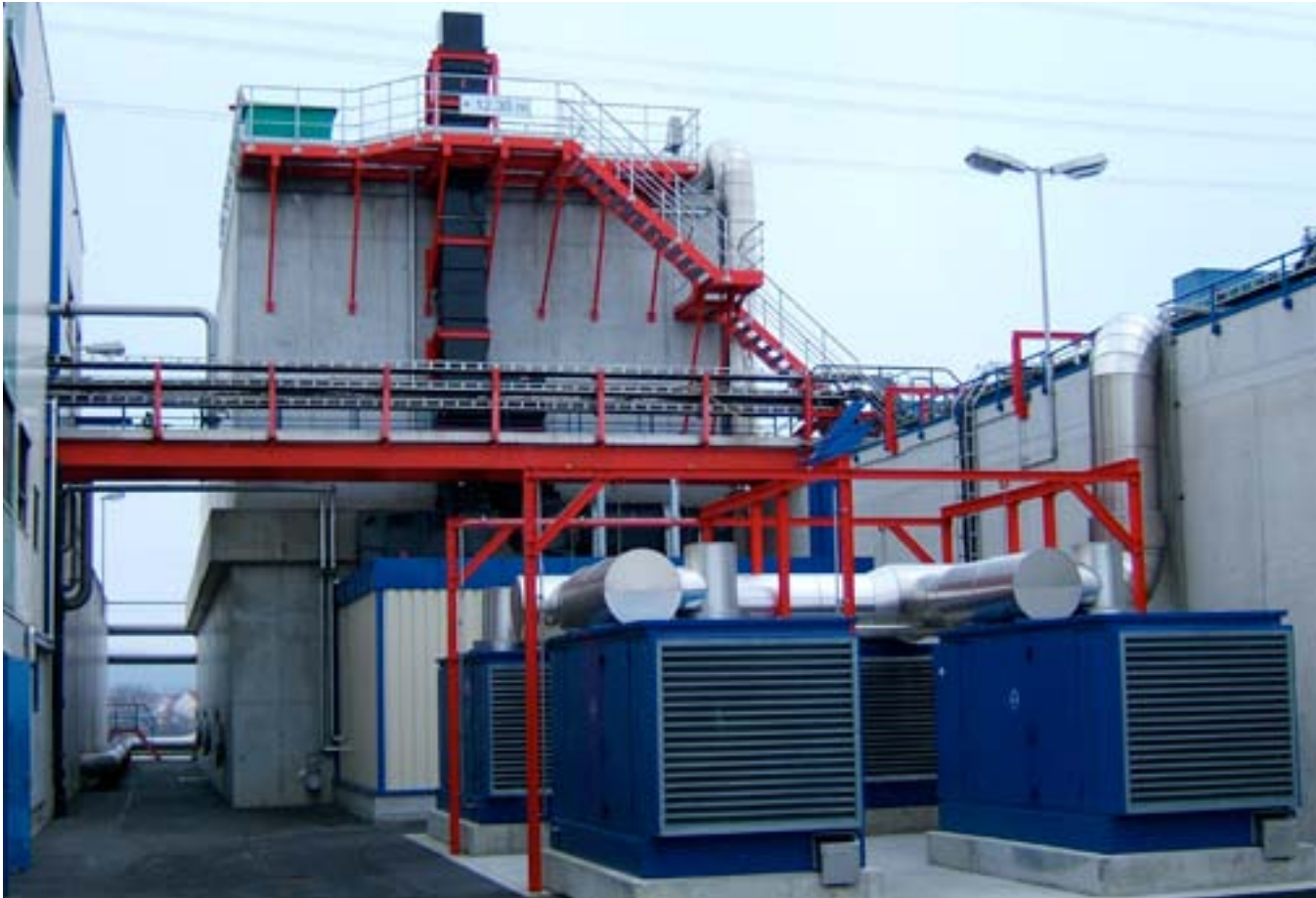
Реактор с подвижным слоем BIOFIT®.H для очистки сточных вод при производстве целлюлозы.

The fluidised bed reactor BIOFIT®.H for the treatment of pulp wastewaters.